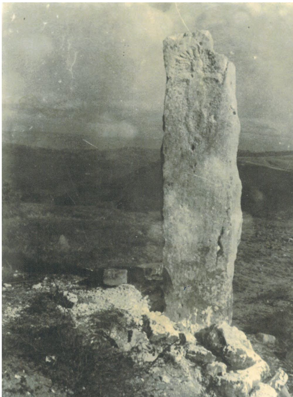
Starejša fotografija kamna v Krkavčah