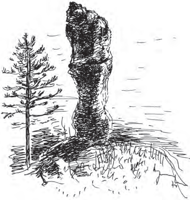
Stane Jarm, Okamneli lovec, »mož«, na Loški steni nad Osilnico

je bilo prej zgoraj, zato je okamnel lovec. Od takrat stoji pod Loško Steno kamniti mož. Pravijo, da ta kamen še raste. Zdaj je visok že okoli dva do tri metre 17 .